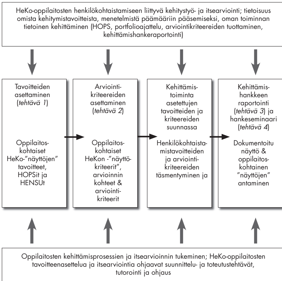
KUVIO 1. Oulun ammatillisen opettajakorkeakoulun HeKO-koulutukseen liittyneet henkilökohtaistamisen kehittämistehtävät näyttöihin liittyvän käsitteistön valossa tarkasteltuna.

Koulutuksen ja sen kuluessa HeKo-koulutukseen osallistuneille annettujen oppimistehtävien lähtökohtana oli ajatus siitä, että oppilaitokset ja niistä koulutuksessamme mukana olevat opettajat ovat itse keskeisesti suunnittelemassa ja myös määrittämässä omien henkilökohtaistamiseen tähtäävien opintojensa sisältöä. Ensimmäisenä tehtävänä HeKo-opiskelijoilla oli tehdä esitys niistä teemoista, joita he toivoivat yhteisissä teemaseminaareissa käsiteltävän. Samoin koulutukseen osallistuvien tuli laatia koulutuksen alussa oma HOPS HeKo-koulutukseen, jossa heidän tuli suunnitella mm. omien vapaavalintaisten opintojen sisältöä sekä oppilaitoskohtaisen kehittämishankkeen tavoitteita. Siten HeKo-opiskelijoilla oli oppimistehtävän myötä